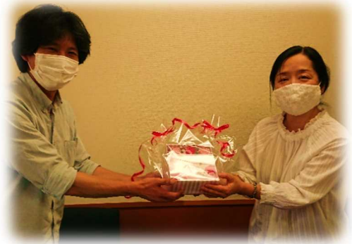
役員引継会での一幕

9年間のさまざまな出来事がよみがえってきます。小学校に入学してから中学校を卒業してしまう年月です。我ながら驚きます。たくさんの出会いがありました。楽しい思い出も数限りなく浮かんできます。その中でも神事研役員2年目から政令指定都市給与費移管に伴う組織改編の検討を始めたことが最大のとりくみとなりました。3政令市の方々の不安を目の当たりにし、地域の各研究会の地域課題も知るようになりました。この頃は諸先輩方が現役にたくさんいらっしやって、研究会の歴史や大切にされてきたことを学ばせていただきました。とりまとめや調整で苦しい時期もありましたが、いつの間にか成長させていただき、私自身が古株になっていきました(^-^*) この組織改編は私にとって「神奈川の学校事務への思い」を深めていくきっかけにもなったようです。